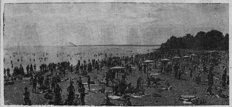
Ленинградское лето. На Зеленогорском пляже.