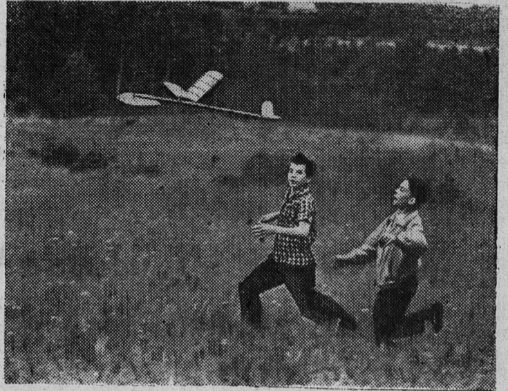
Юные авиамodelисты.