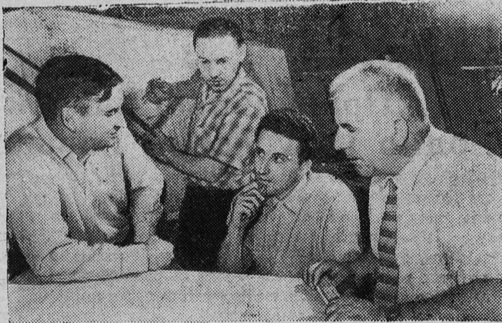
Конструкторы филиала Всесоюзного научно-исследовательского института электропромышленности при заводе «Электросила» имени С. М. Кирова взяли обязательство разработать технический проект гидрогенератора мощностью в 300 тысяч киловатт для Нурекской ГЭС на реке Вахи.