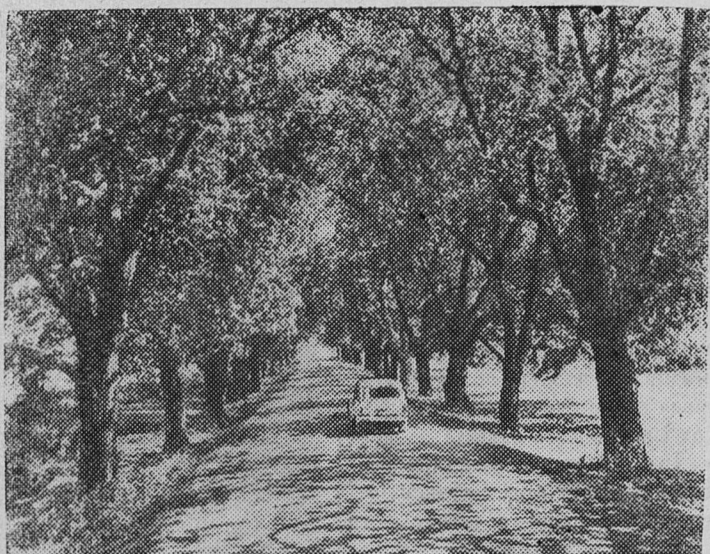
АЗЕРБАЙДЖАНСКАЯ ССР. Живописная автострада Нуха — Кахи — Закаталы. Десятки километров ее проходят среди ореховых рощ.

НА СНИМКЕ: ореховые деревья на автостраде Нуха — Кахи — Закаталы.