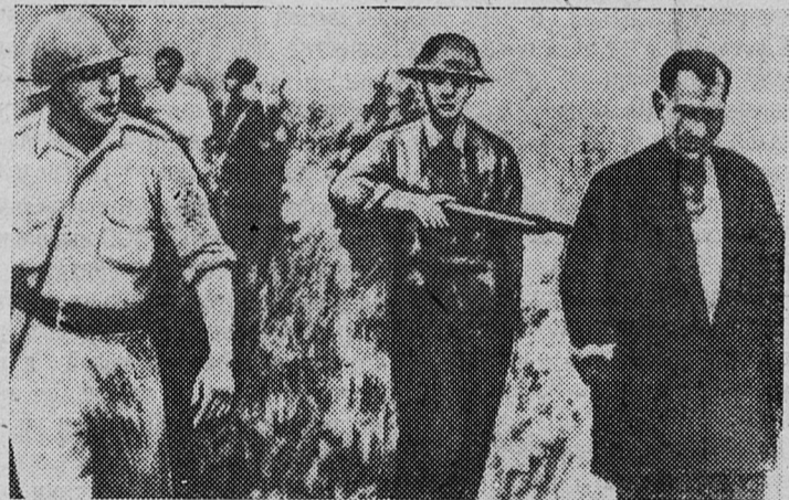
Этот снимок доставлен в английскую газету «Дейли Уоркер», несмотря на строгости салазаровской цензуры. Португальские солдаты ведут взятую в плен анголезца. Тысячи пленных анголезцев были расстреляны салазаровскими солдатами.

ПАРИЖ. (ТАСС). Как передает корреспондент агентства Франс Пресс, ангольские патриоты совершили новое нападение на португальских карателей близ Кармоны. Он сообщает также, что колониальные власти Луанды собираются послать войска в район Иколо — Бенго в связи с усилившимся там партизанским движением.