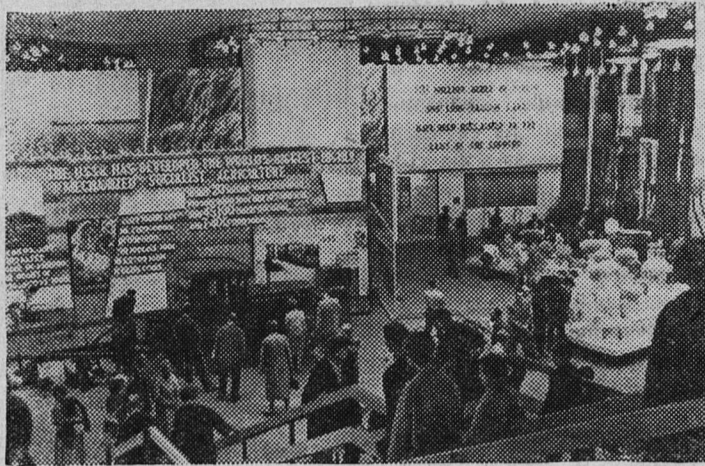
В разделе «Сельское хозяйство».