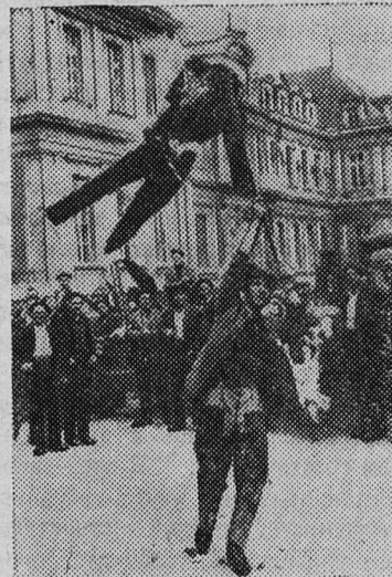
Во Франции продолжаются выступления крестьян, недовольных аграрной политикой правительства.

ТУНИС. (ТАСС). Как сообщает ТАП, тунисские власти в Сфаксе установили контроль над нефте-сооружениями Сххири, где оканчивается французский нефтепровод, идущий из Алжира. Эти меры были приняты в качестве репрессалий в соответствии с директивой президента Туниса.