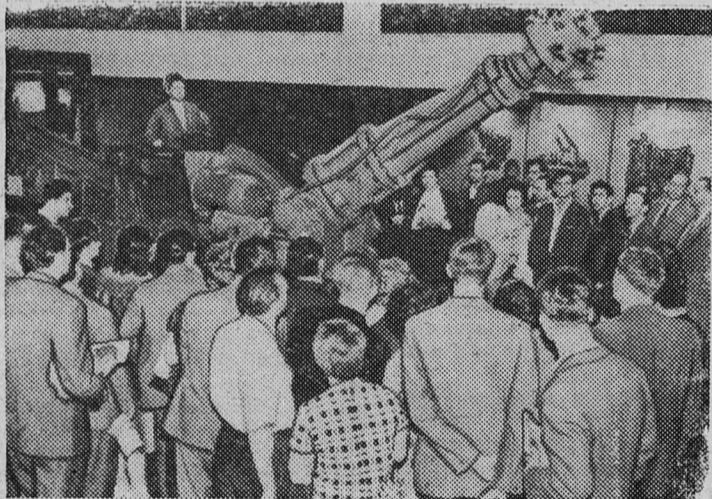
В разделе «Уголь». Большой интерес у посетителей вызывает проходческий угольный комбайн ПК-3, изготовленный Копьевским заводом.