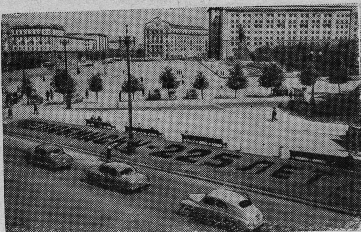
На площади Революции.