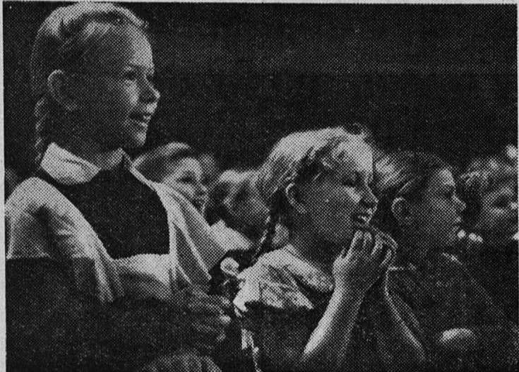
Фотоэтиюд. На концерте.