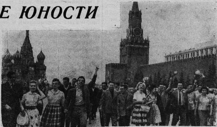
НА СНИМКЕ: группа молодежи из стран Латинской Америки с москвичами на Красной площади.

Впечатления о первых днях форума можно выразить одним словом «хорошо», сказал член бюро Всемирного Совета Мира, известный английский юрист Деннис Притт. Приятно отметить, подчеркнул он, единство мнений участ-