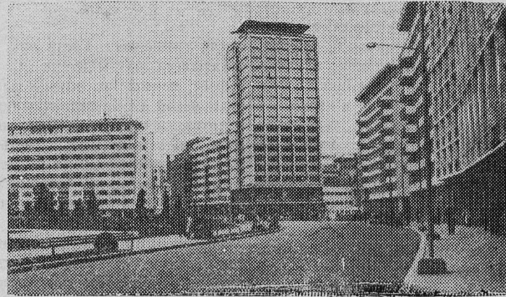
Столица Румынской Народной Республики Бухарест. Квартал новых жилых домов.

Министерство внутренних дел указывает, что эти мероприятия останутся в силе до заключения мирного договора.