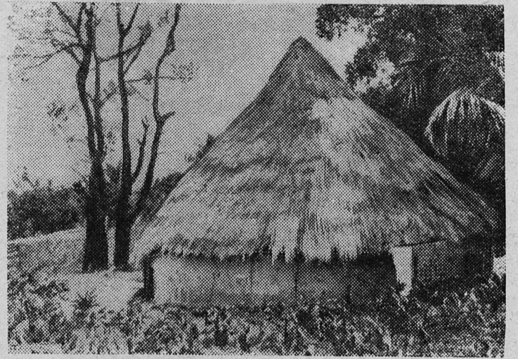
Гвинейская Республика. Типичная хижина местного жителя в селе близ Конокри.