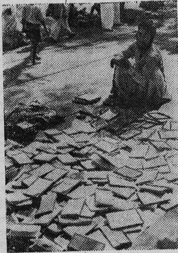
Республика Индия. Продавец книг на улицах Дели.

Собравшиеся в Варшаве деятели всемирного движения сторонников мира, а также многочисленные гости обсудят вопросы, связанные с предотвращением опасности войны, всеобщим и полным разоружением, укреплением всеобщего мира.