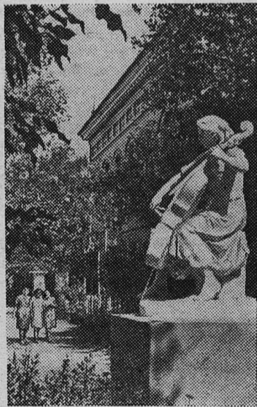
Ленинградская область. На снимке: в сквере у Дома культуры в Тихвине.