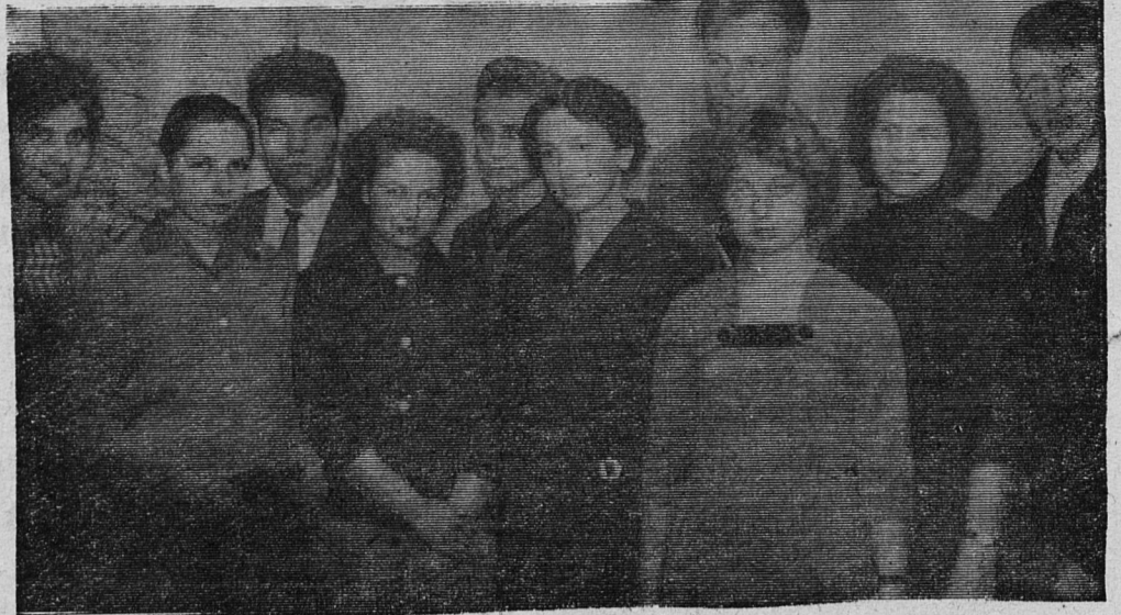
НА СНИМКЕ: группа делегатов IV комсомольской конференции комбината «Сланцы» во время перерыва.

Конференция закончилась пением гимна «Интернационал». Отчет о работе конференции печатается на этой странице.