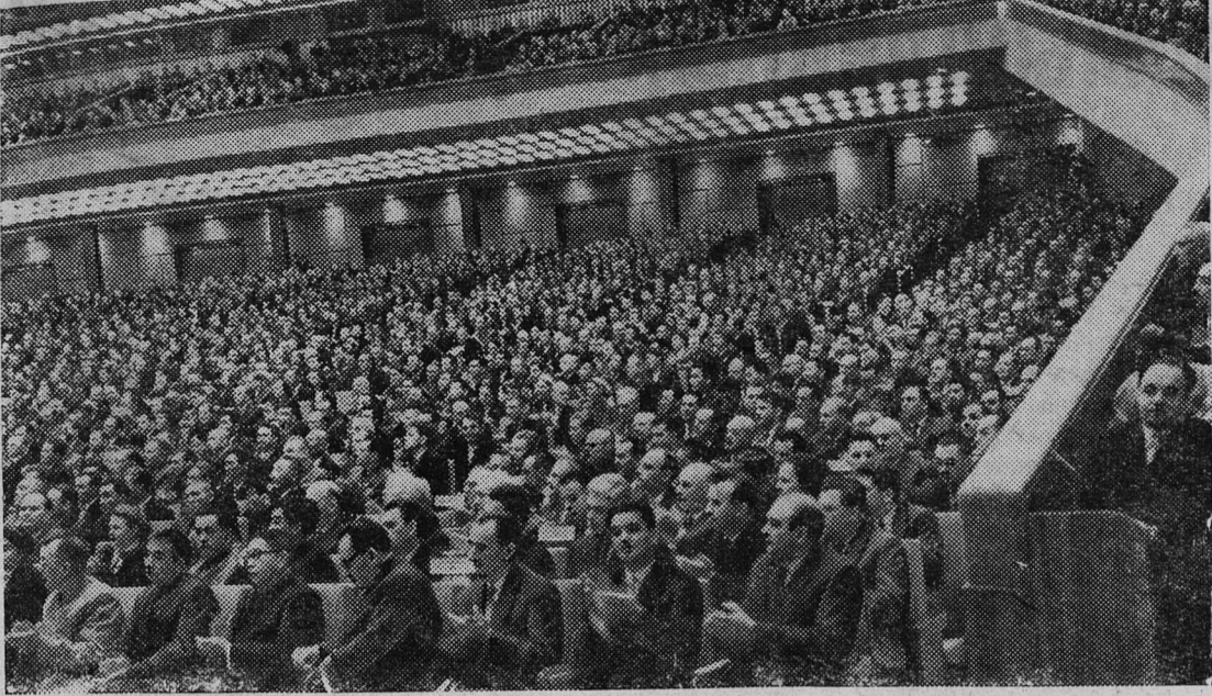
Москва. XXII съезд Коммунистической партии Советского Союза.

№ 208 (3222) | Пятница, 20 октября 1961 г. | Цена 2 коп.