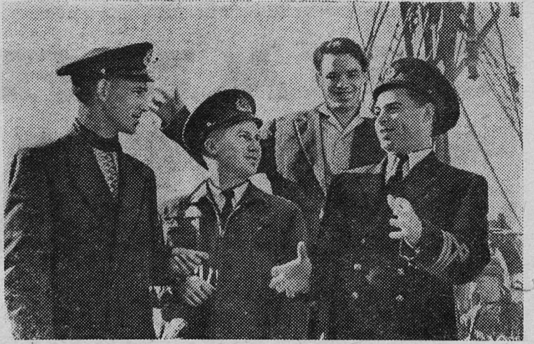
Камчатская область. Экипаж рыболовного траулера «Юрий Гагарин» — один из лучших на Дальнем Востоке. Недавно экипаж коммунистического труда с гордостью отпартовал телеграммой герою-космонавту, имя которого носит судно: «...досрочно выполнены социалистические обязательства, принятые в честь XXII съезда КПСС. Вместо десяти тысяч по годовому плану добыто 15 тысяч центнеров рыбы».