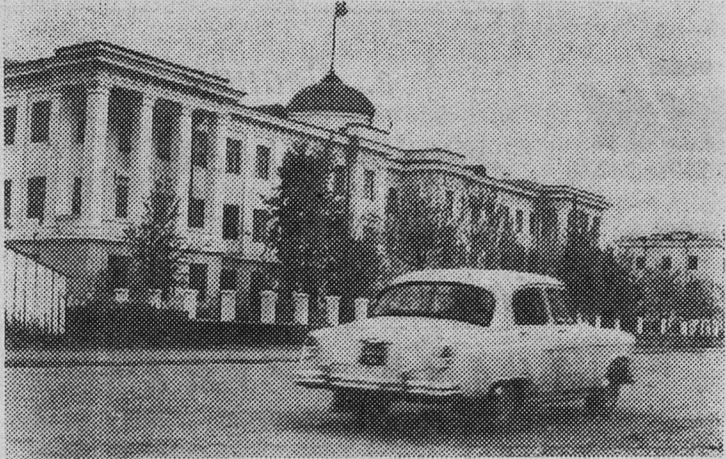
Указом Президиума Верховного Совета СССР Тувинская автономная область преобразована в Тувинскую Автономную Советскую Социалистическую Республику.