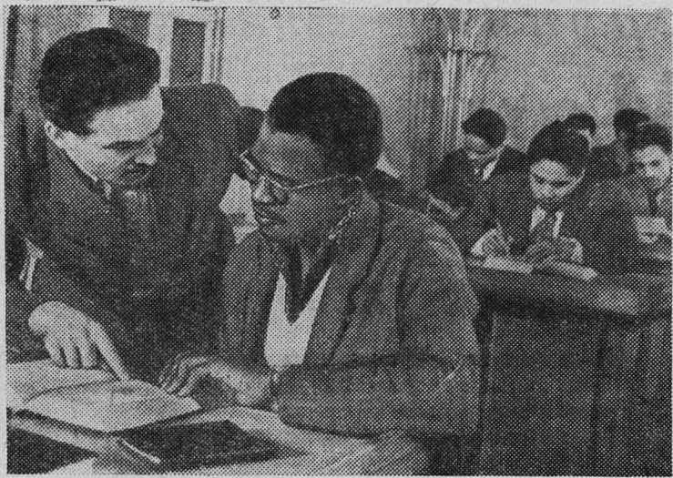
В Киевском государственном университете имени Т. Г. Шевченко на подготовительном факультете учится молодежь из Алжира, Афганистана, Объединенной Арабской Республики, Ганы, Гвинеи, Нигерии, Индонезии, Камеруна и других стран Азии и Африки.

Дело подлежит рассмотрению в нарсуде Гдовского района, Псковской области.