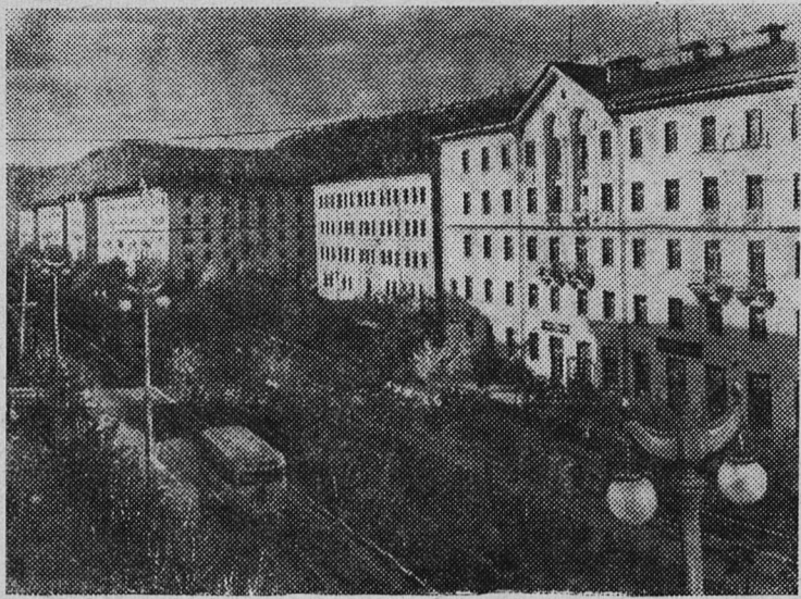
КЕМЕРОВСКАЯ ОБЛАСТЬ. Комсомольский проспект в молодом шахтерском городе Междуреченске.