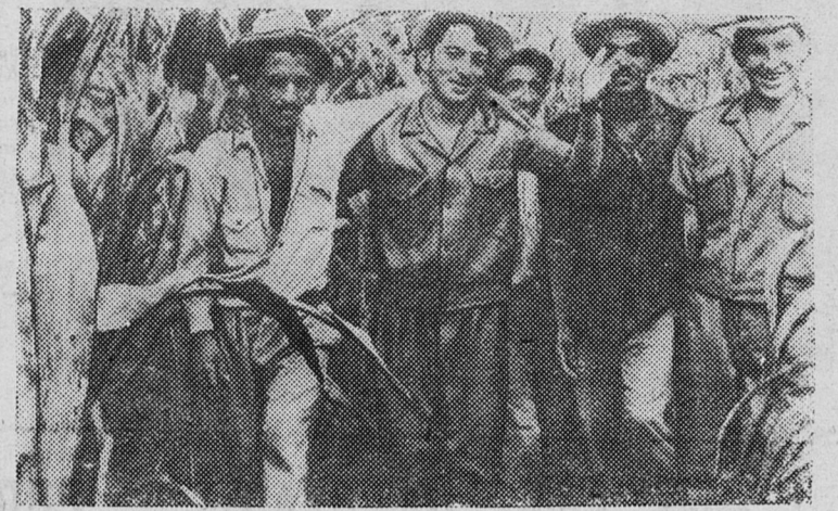
Группа молодых механизаторов и агрономов, прибывшая из СССР, работает в народном имени «Иван Родригес» (провинция Ориенте). Они рассказывают кубинским крестьянам о достижениях советских колхозов и совхозов, делятся своим опытом и знаниями.

НА СНИМКЕ: советские и кубинские друзья.