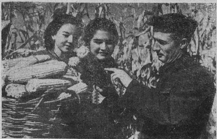
СЕВЕРО-ОСЕТИНСКАЯ АССР. Ученическая бригада старшеклассников Ольгинской средней школы Правобережного района добилась больших успехов, собрав 600 тонн семенной кукурузы!

18.30 — Для молодежи: «Это актуально». 18.50 — Соревнование по боксу между командами Финляндии и Эстонии. Трансляция из Кадрнорского теннис-холла. По окончании (примерно в 22 часа): «Актуальная камера», художественный фильм «Обвал» и «Телеграммы сообщают...» II ПРОГРАММА. 18.30 — Трансляция из Ленинграда.