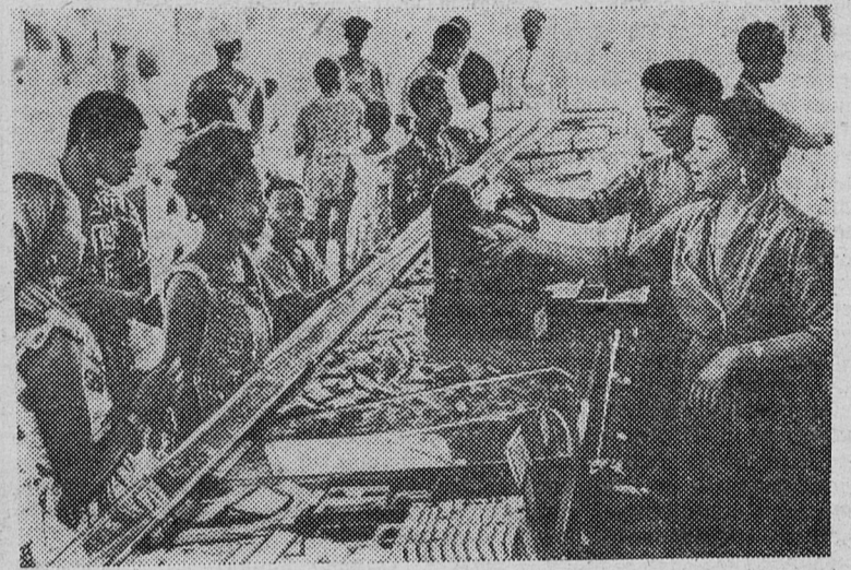
Население Гвинеи в период французского колониального владычества обиралось французскими и местными купцами. В Республике Гвинее созданы государственные магазины, в которых товары продаются по справедливым ценам.

Выступая на сессии Генеральной Ассамблеи, многие делегаты отмечают, что колониализм переживает агонию, но, как тяжело раненый хищник, отчаянно сопротивляется, творя кровавые преступления. Например, за семь лет колониальной войны в Алжире погибло около 80 тысяч алжирцев. Десятки тысяч брошены в тюрьмы. Повсюду сейчас гневно осуждают действия французских властей, незаконно арестовавших в октябре многих алжирцев — жителей Франции. Протестуя против недопустимых условий заточения, более 10 тысяч алжирцев, находящихся во французских тюремных застенках, объявили длительную голодовку.