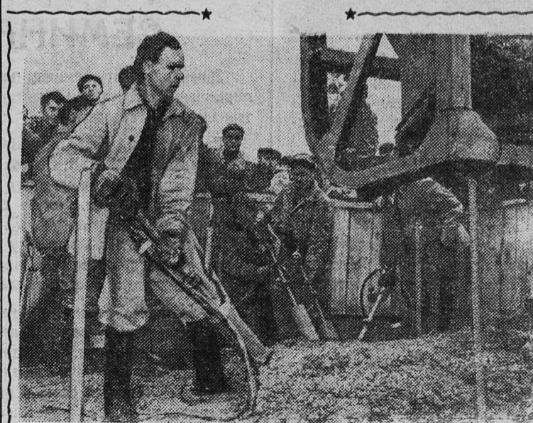
Красноярский край. Строители крупнейшей в мире Красноярской ГЭС ведут укладку бетона в тело плотины ГЭС.

С высоким трудовым подъемом работают электромашиностроители московского завода имени Владимира Ильича, станкостроители завода имени Серго Орджоникидзе, обувщики фабрики имени Капранова и производственники других предприятий столицы.