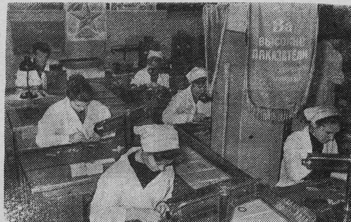
ЛЕНИНГРАД. Около 900 производственников завода «Радист» (на Малой Охте) соревнуются за высокое звание ударников, бригад и цехов коммунистического труда. Добрая слава идет о лучшей бригаде цеха сборки реле. За отличные показатели в труде бригаде присвоено звание коммунистической и переходящий вымпел «Передовая бригада цеха».