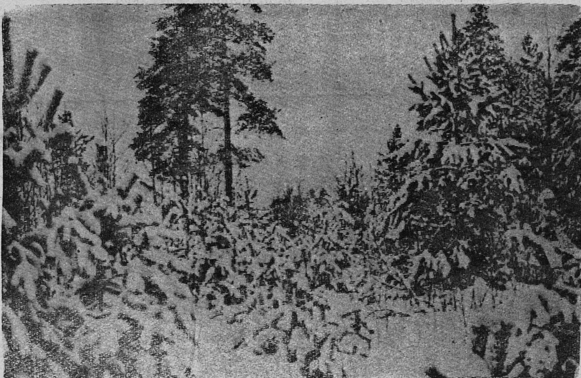
ПЕРВЫЙ СНЕГ В ЛЕСУ.

А какая же фамилия является самой редкой в мире? На этот вопрос ответить труднее. Очевидно, та, которую носит одна бирманская семья. В ней нет ни одной буквы и обозначается она путем одного апострофа!