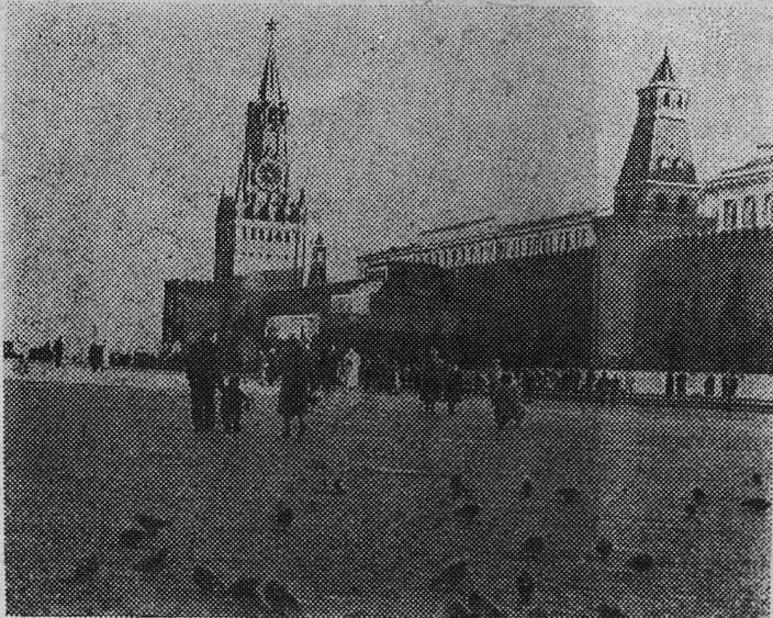
Столица нашей Родины — Москва. Красная площадь.

Выполнив производственный план 11 месяцев, механизаторы с новым трудовым подъемом развернули соревнование за досрочное выполнение годового плана.