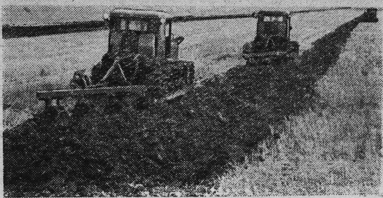
ЦЕЛИННЫЙ КРАЙ. 24 тысячи гектаров зяби предстояло поднять работникам совхоза «Комсомольский» Целиноградской области. На зяблевой вспашке в совхозе работало около 60 гусеничных тракторов.

— В ближайшие годы намечается ввести в эксплуатацию не менее 10.000 квадратных метров жилой площади, три детских сада, 8 бань, пекарню, проведем водо-