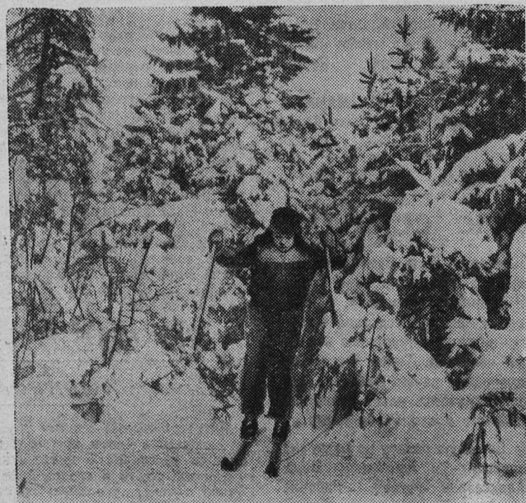
ЛЕНИНГРАДСКАЯ ОБЛАСТЬ. На первой лыжной прогулке в Кавголово.

«Я могу заставить говорить любого человека, — заявил недавно, бахвалясь перед буржуазными корреспондентами, диктатор Никарагуа Сомоса. — Мне нужна только зажженная спичка и его голая нога...» Этот холуй в генеральских эполетах, навешанных им самим на себя, правит милостью американского империализма. Если бы не поддержка из Соединенных Штатов, не угроза вторжения войск США, Сомоса с его бандой давно был бы сметен штормом народного гнева.