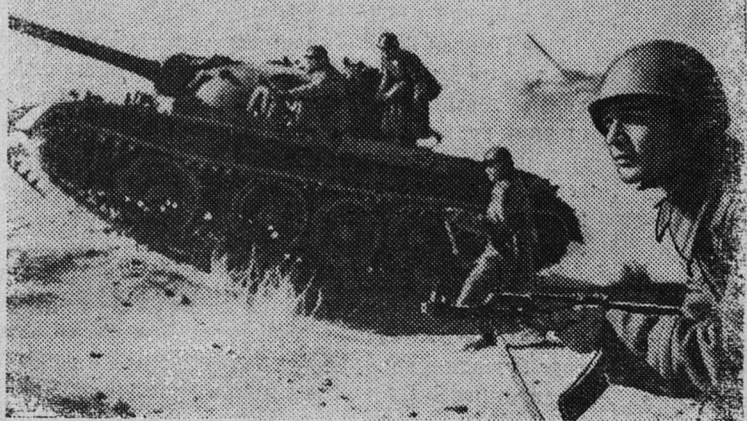
В Н-ской части на тактических занятиях.

он просится. Сегодня, говорит, 22 февраля — канун Дня Советской Армии, надо же этому празднику боевой подарок преподнести.