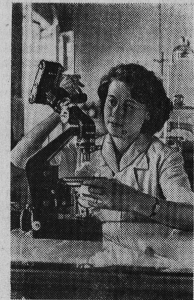
ВЛАДИМИРСКАЯ ОБЛАСТЬ. Город Гусь - Хрустальный — крупный центр стекольной промышленности. В этом старинном городе русского стеклодела создан филиал Государственного научно-исследовательского института стекла. Его коллектив занят разработкой новых составов стекол.