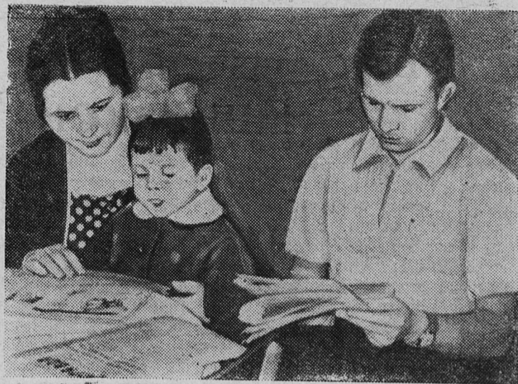
Юрий Алексеевич Гагарин с женой Валентиной Ивановной и дочерью Леной.

В настоящее время в ответ на героический подвиг первого летчика-космонавта СССР Юрия Гагарина труженики цеха дубителей ищут новые пути увеличения выработки продукции, вскрывают резервы повышения производительности труда и снижения себестоимости дубителя.