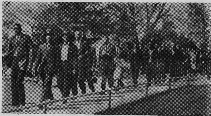
Соединенные Штаты Америки. Участники демонстрации негров против сегрегации. Они прошли перед зданием законодательного собрания города Колумбия (штат Южная Каролина). Агентство Ассошиэйтед Пресс, распространяя этот снимок сообщало, что позднее демонстранты были арестованы полицией.

Корреспондент агентства Рейтер передает с мыса Канаверал (США): здесь было официально подтверждено, что американские ракеты «Юпитер» уже находятся на стартовых площадках в Италии.