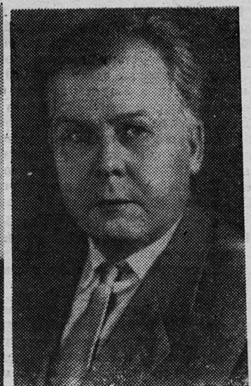
ская — не водица» — роман, «Большая родня» — роман.