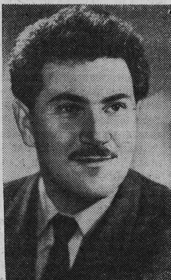
1. Чухраю Григорию Наумовичу, режиссеру и автору сценария, — за художественный фильм «Баллада о солдате».