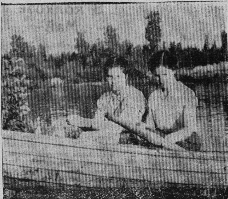
ПОДРУГИ НА ПРОГУЛКЕ.