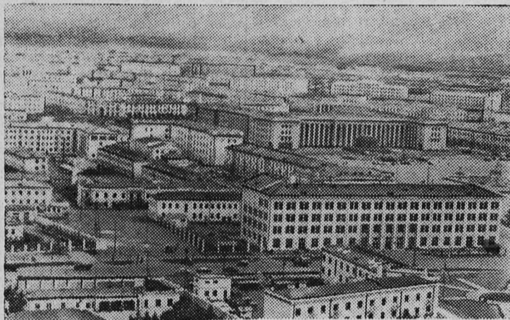
Столица Народной Республики Монголии Улан-Батор. (Вид с вертолета).