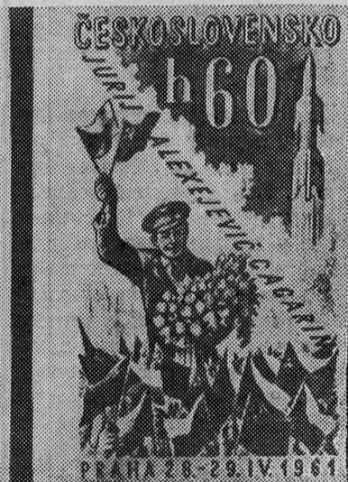
Две почтовые марки, посвященные первому в мире космонавту Ю. А. Гагарину, которые будут выпущены в ближайшее время в Чехословацкой Социалистической Республике.