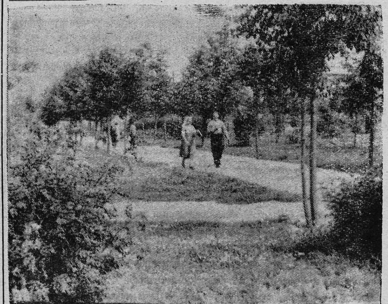
Любят и благоустраивают сланцевчане свой родной город. Из года в год в нем появляется все больше зеленых насаждений. В зеленый наряд оделись улицы Ленина, Свердлова, Кирова. Радуют взоры жителей города скверы, аллеи, цветочные клумбы, разбитые на улицах и во дворах домов.