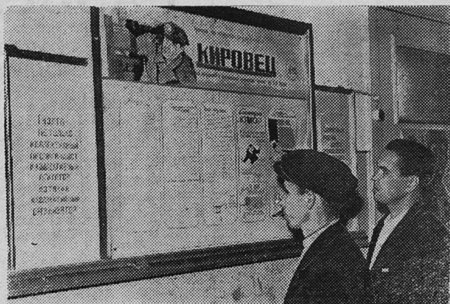
На снимке: возле свежего номера газеты «Кировец».