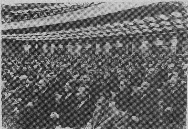
Москва. XXII съезд Коммунистической партии Советского Союза.

На снимке: ленинградские делегаты в зале заседаний.