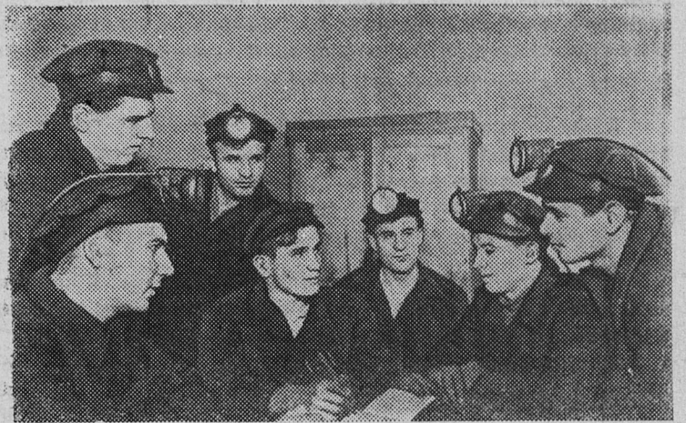
Сталинская область. Горняки шахты № 9 треста «Снежинантрацит» стали на трудовую вахту в честь XXII съезда КПСС. Ежедневно они выдают десятки тонн угля сверх задания.

В. ГОЛУБЕВ, воспитатель строительного училища № 5.