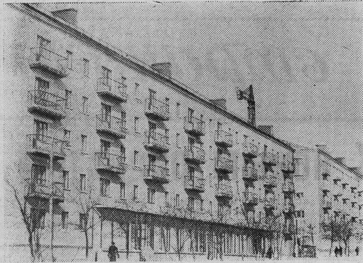
РОСТОВСКАЯ ОБЛАСТЬ. На одной из центральных улиц горняцкого города Шахты выросли новые пятиэтажные жилые дома. В них в ближайшее время отпразднуют новоселье 128 семей работников комбината «Ростовуголь».

Дело подлежит рассмотрению в Сланцевском городском народном суде.