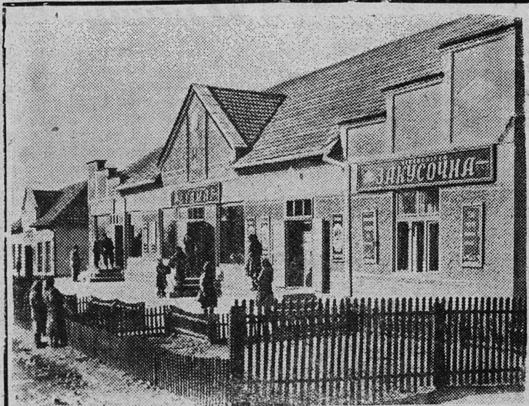
ЗАКАРПАТСКАЯ ОБЛАСТЬ. Работники Иршавского райпотребсоюза улучшают торговлю на селе. Открываются новые специализированные магазины, швейные и сапожные мастерские, чайные, пекарни, комбинаты бытового обслуживания.

Новое здание комбината бытового обслуживания построено в горном селе Имстичево.