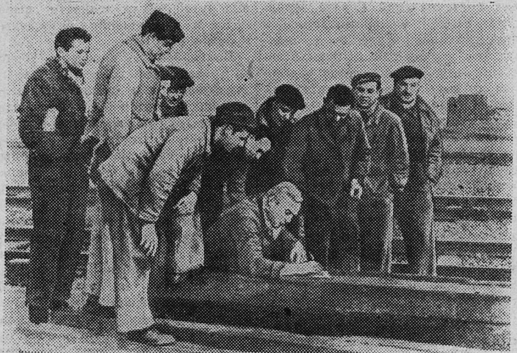
Трудящиеся Франции усиливают борьбу за немедленное прекращение войны в Алжире, продолжающейся более шести с половиной лет.

НА СНИМКЕ: железнодорожники Лиона проводят сбор подписей под резолюцией, требующей прекращения позорного кровопролития в Алжире.