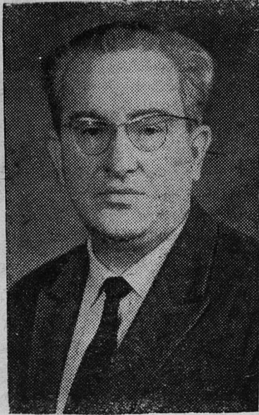
Ефремов Л. Н., кандидат в члены Президиума ЦК КПСС. Андропов Ю. В., секретарь ЦК КПСС.