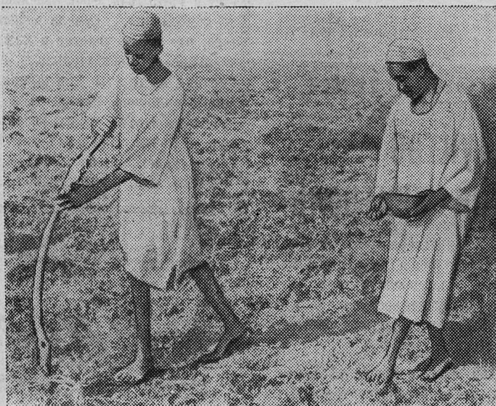
В Судане таким примитивным способом производится сев — посредством простой палки «селуки». Ею делают углубления в земле, а затем бросают в них семена. На снимке: сев на суданских полях.