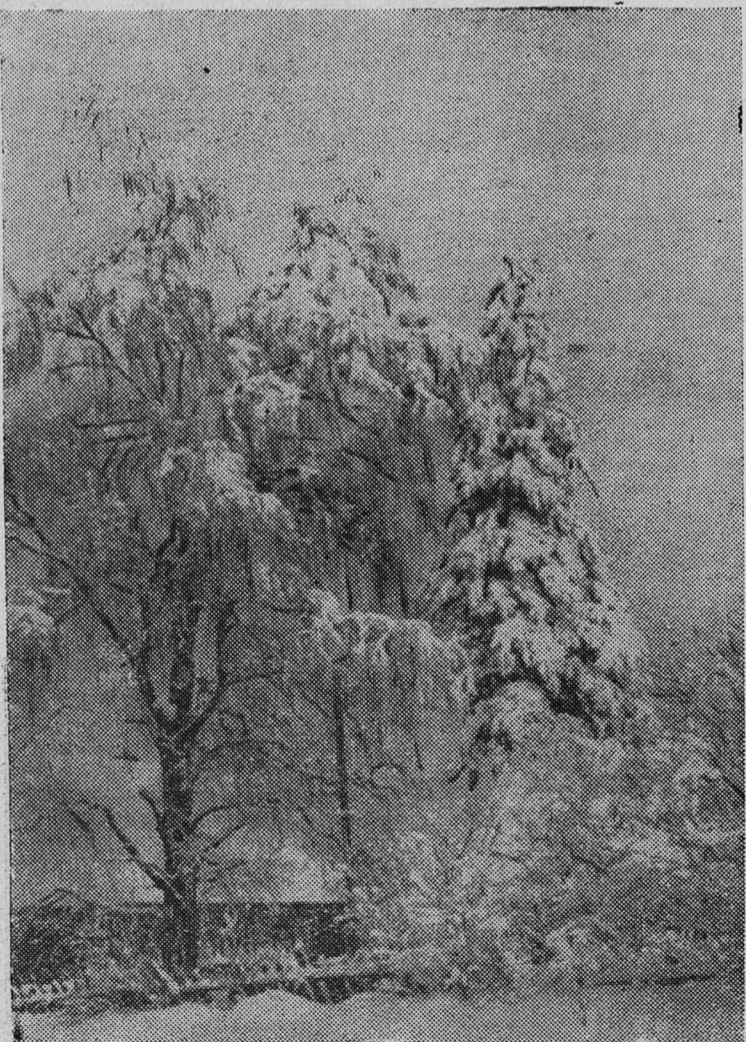
Хорошо днем в зимнем лесу!