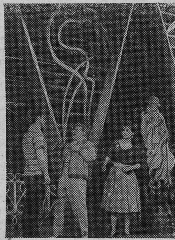
В Ленинградском театре музыкальной комедии состоялась премьера оперетты лауреата Ленинской премии В. Соловьева-Седого «Олимпийские звезды». НА СНИМКЕ: сцена из спектакля.