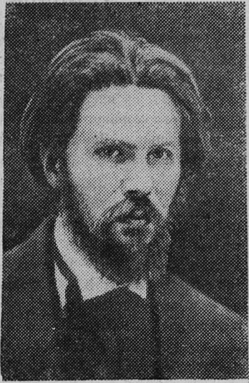
И. Н. КРАМСКОЙ

Влечение И. Н. Крамского к искусству первоначально не встречало сочувствия окружающих. Ни городская школа, где он учился, ни мастерская воронежского иконописца, куда мать отдала его в учение после смерти отца, ничего не дали ему для художественного образования.