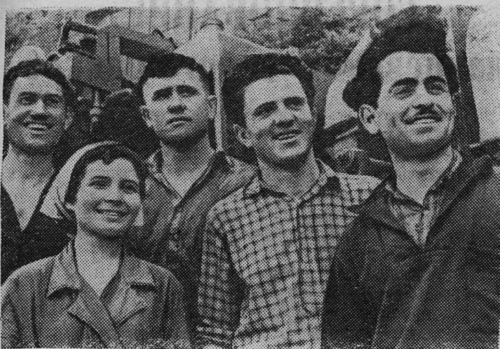
Азербайджанская ССР. В комсомольские райкомы Баку поступают заявления от многих молодых нефтяников, желающих отправиться в поход за большой нефтью в Сибирь. Комсомолы Бакинского машиностроительного завода имени лейтенанта Шмидта изготовили сверхплана передвижной буровой агрегат «УБШ-1», который будет отправлен к берегам Байкала с первым эшелом бакинских добровольцев. На снимке: группа комсомольцев, участвовавших в создании сверхпланового бурового агрегата в подарок иркутским нефтяникам.