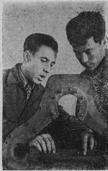
ТУРКМЕНСКАЯ ССР. Ежегодно в колхозы и совхозы республики приходят сотни молодых механиков, окончивших училища механизации сельского хозяйства. Стремление получить специальность бульдозериста, экскаваторщика, тракториста стало обычным у сельской молодежи.