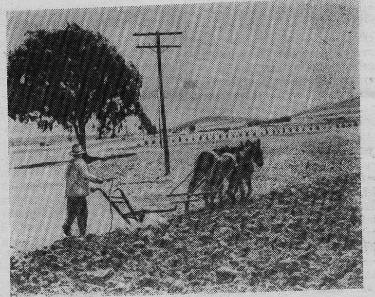
МЕКСИКА. Как и сто лет тому назад, трудится мексиканский крестьянин на своем поле, надох от которого едва можно прокормить семью.