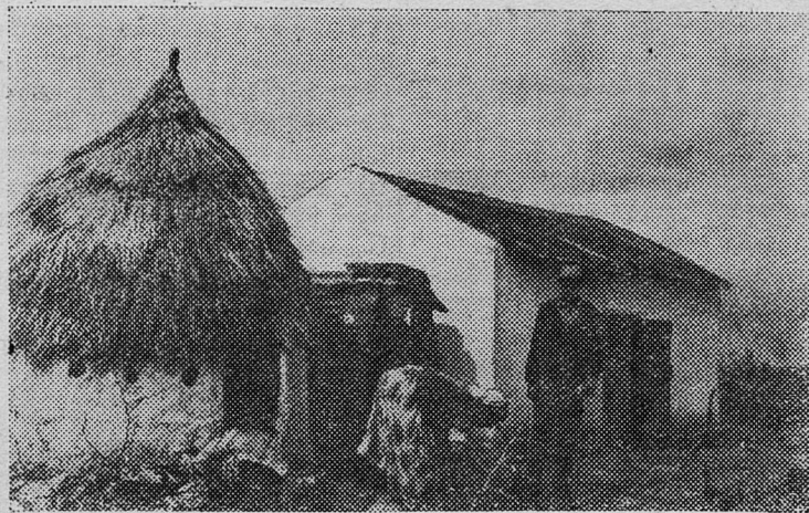
МАРОККО. Жилище марокканского крестьянина в окрестностях Рабата.