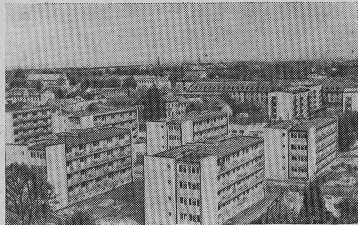
Польская Народная Республика. В городе Плоцке ведется широкое жилищное строительство.