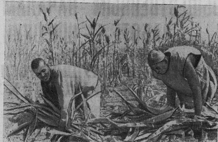
Республика Чад. Сорго — одна из ведущих сельскохозяйственных культур в стране. На снимке: уборка сорго.