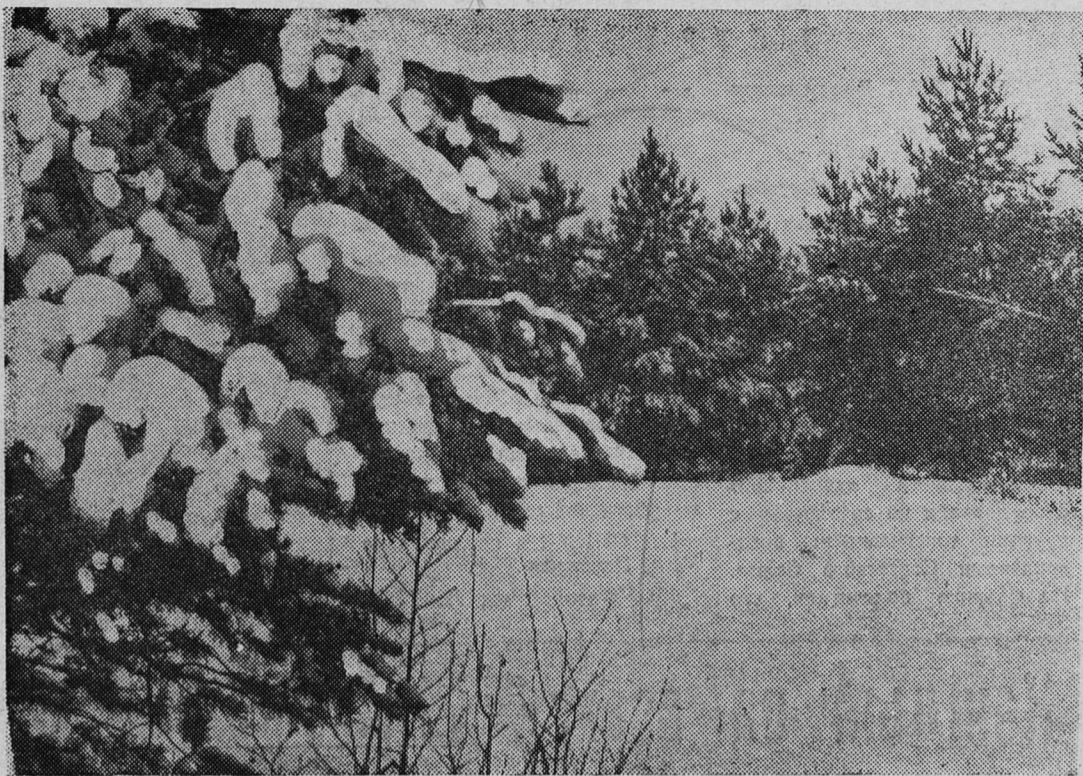
ЗИМОЙ В ЛЕСУ.