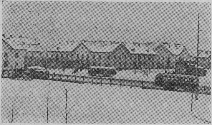
НА СНИМКЕ: зимним днем на улице Ленина.