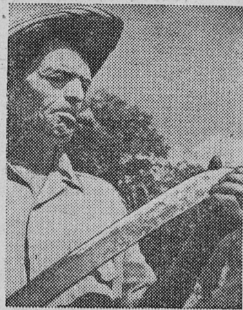
РЕСПУБЛИКА КУБА. Крестьянин с мачете — ножом для резки сахарного тростника.

Представители Советского Союза, подчеркнул в заключение А. А. Громыко, сделают все возможное, все от них зависящее, для того чтобы добиться положительных результатов в работе Комитета. Народы ожидают, что и все остальные участники переговоров также проявят добрую волю и стремление к соглашению.