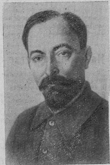
Ф. Э. ДЗЕРЖИНСКИЙ

ла к мирному строительству. Промышленность и транспорт были разрушены, сельское хозяйство вляло жалкое существование. Чтобы восстановить народное хозяйство, нужно было, прежде всего, восстановить транспорт. И на этот, самый горячий участок тру-