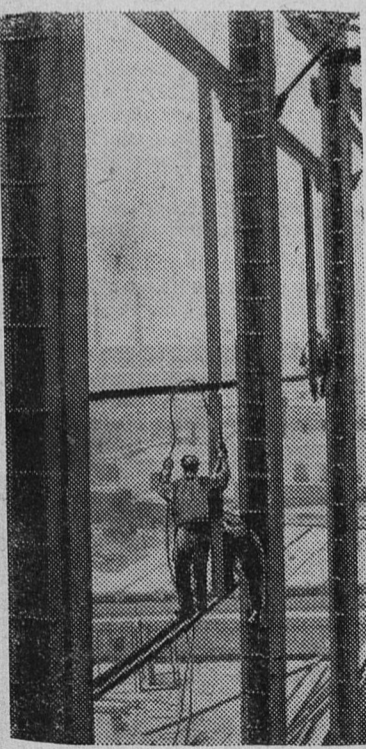
Оренбургская область. В Орске вступила в строй четвертая очередь ТЭЦ. Мощность станции увеличена на одну треть. Сейчас здесь сооружается новая котельная, где будут установлены дополнительные котлы высокого давления.