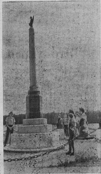
Наш народ свято хранит память о Бородинской битве. Сейчас, накануне юбилея, поток людей, приезжающих посмотреть поле русской славы, неизмеримо вырос.