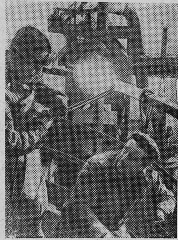
ВЕНГЕРСКАЯ НАРОДНАЯ РЕСПУБЛИКА. Строительная мощная доменная печи на металлургическом заводе в городе Озде.

Минувшая неделя для участников клубной самодеятельности была особенно напряженной. В день выборов в Верховный Совет СССР