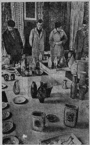
Ленинград. В Высшем художественно-промышленном училище имени В. И. Мухомовой открылась выставка дипломных и курсовых работ студентов. Здесь демонстрируются произведения промышленного искусства, мебели, отделки и оборудования зданий, керамики и стекла, текстиля. На снимке: на выставке.