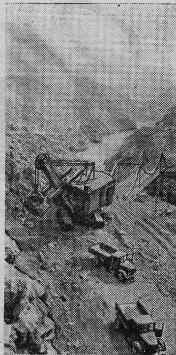
Этот снимок сделан на строительстве Нурекской ГЭС в Таджикистане. Скальный экскаватор прокладывает дорогу для отсыпки первой очереди плотины.