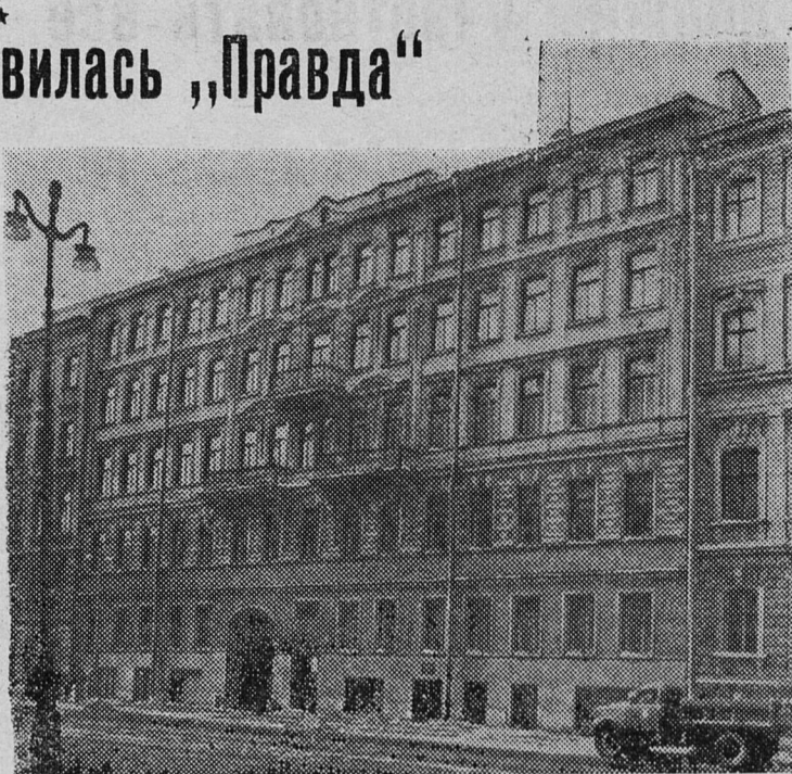
НА СНИМКЕ: дом № 37 на улице Марата (б. Николаевская улица), где в 1912 году находилась редакция газеты «Правда».

При выпуске первого номера «Правды» присутствовали представители рабочих организаций, рабкоры. К моменту выхода первого номера весь двор типографии и лестничная